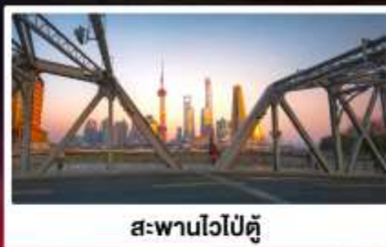
สะพานไวป๋อดู