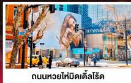
ถนนหวยไห่มีดเคิลโรด