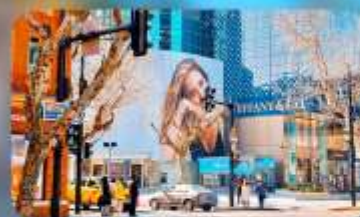
ถนนทวยไห่มีดเคิลโรด