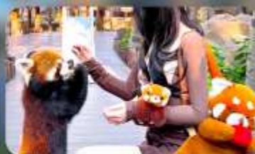
ให้อาหารแพนด้าแดง